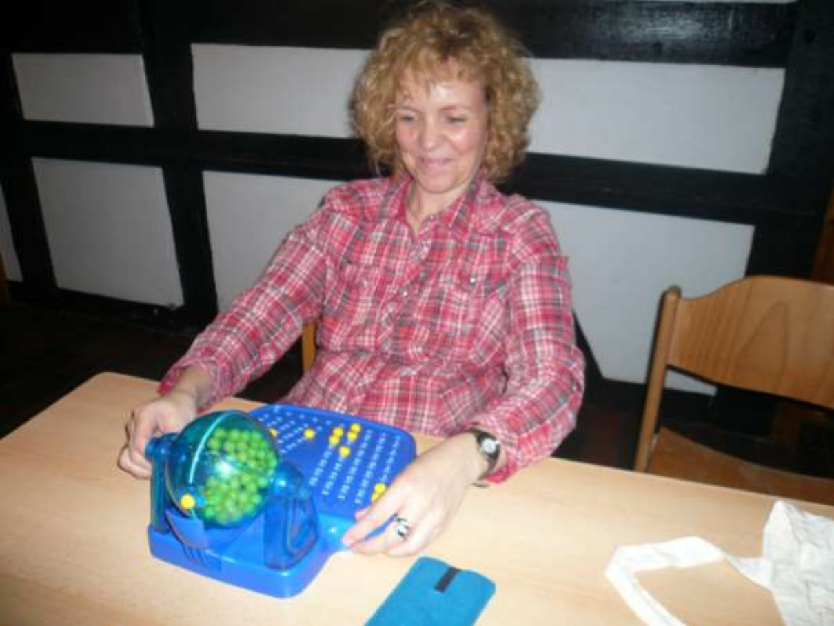
Die „Glücksfee“ sorgte für enorme Spannung....