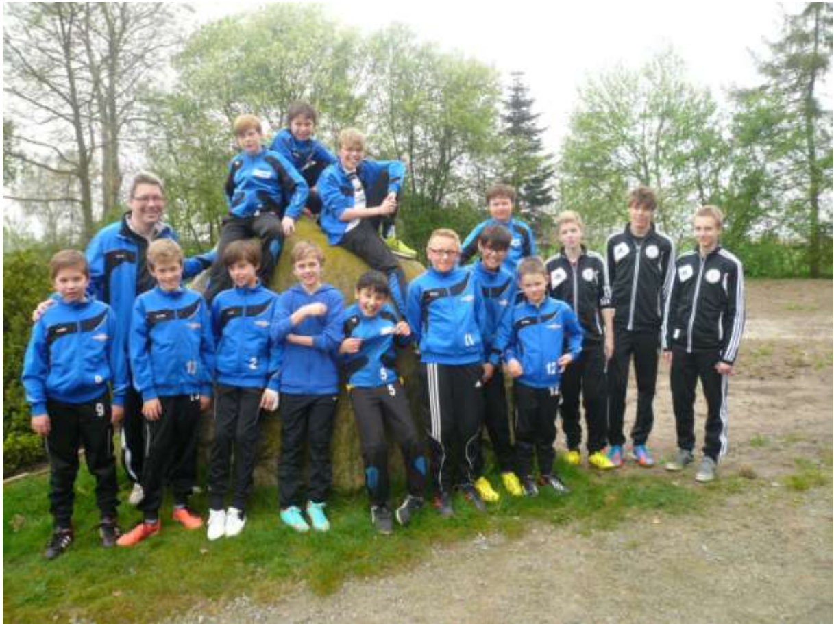
Los ging`s mit Zirkeltraining.....