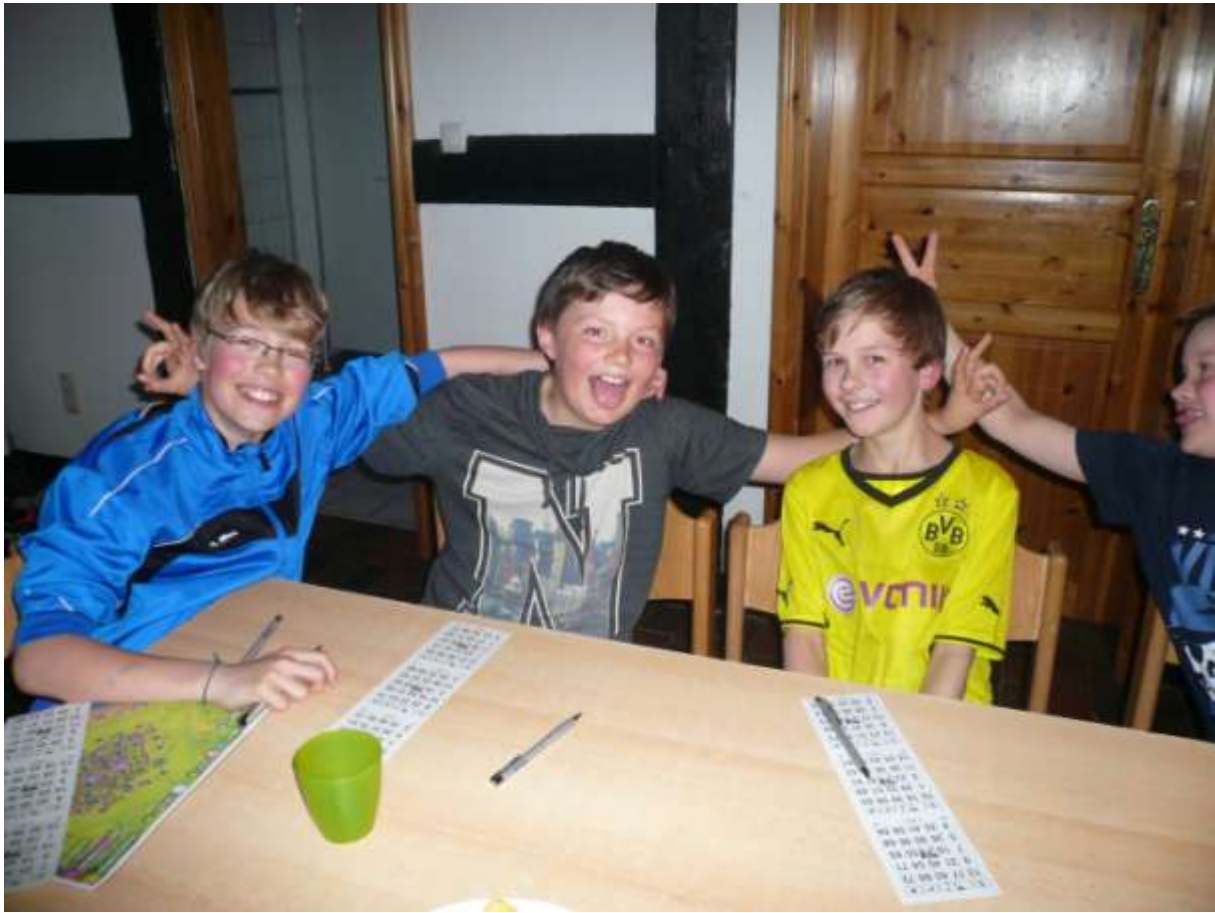
Schnell wurde „Bingo-Nachwuchs“ gefunden...